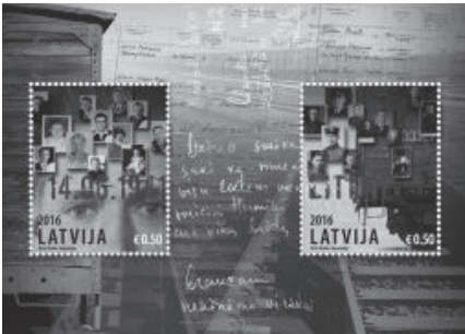
14. jūnija deportācijai un Litenes virsnieku traģēdijai veltītas pastmarkas