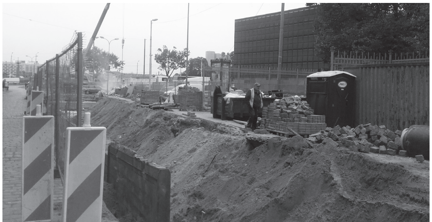
Septembrī Grēcinieku ielā blakus muzeja ēkai sākās siltumtrases pārvietošanas darbi. Jaunajai siltumtrasei būs pievads Nākotnes Namam