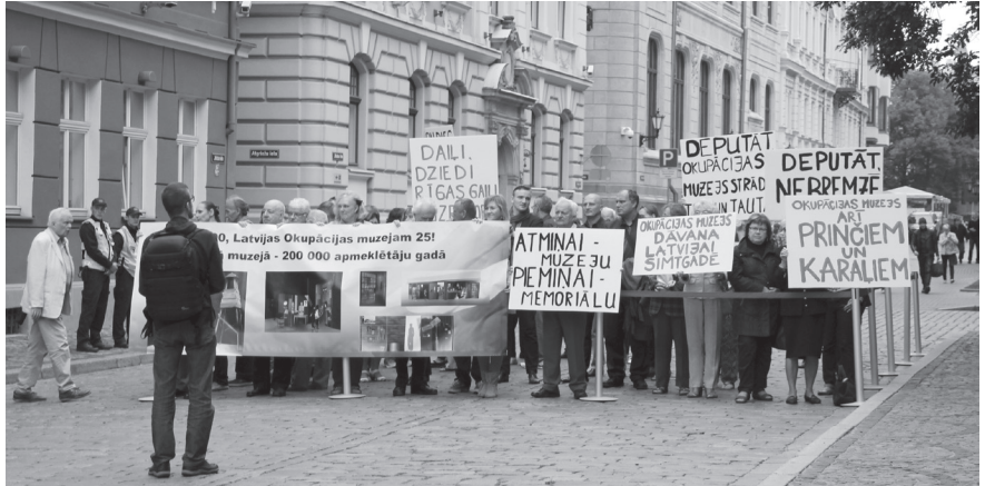
Muzeja rīkotais pikets pie Saeimas nama 8. septembrī, kad Saeima galīgajā lasījumā pieņēma grozījumus Okupācijas muzeja likumā

Jaunums muzeja darbībā ir papildtelpas, kuras esam noīrējuši mūsu pagaidu mītnes ēkas pagrabā. Mūsdienu kultūras foruma "Baltā nakts" ietvaros rīkojam pasākumu "Stāsti smiltis (!)" ar trim aktivitātēm: radošās smilšu darbnīcas, smilšu kino seansi un izstā-