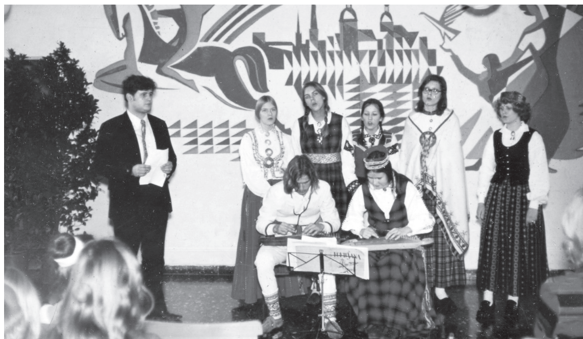
Minsteres Latviešu ģimnāzijas koklētāju ansamblis 1971. gada 18. novembrī

M uzeja Izglītības nodaļa šovasar saņēma 4000 eiro lielu ziedojumu no Minsteres Latviešu ģimnāzijas (MLĢ) bijušo skolēnu un draugu biedrības. Ziedojuma mērķis: Latgales vēstures skolotāju un vēstures skaidrošanai jauniešiem no Latgales – Okupācijas