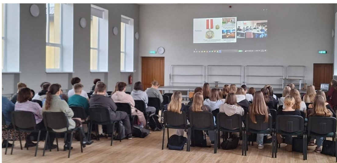
Vidzemes skolas piedalījās muzeja tiešsaistes nodarbībās “Par savu zemi jāstāv. Barikāžu laiks”.