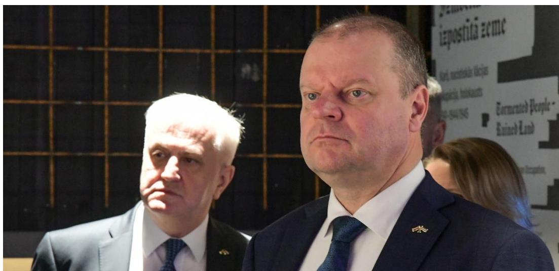
Pa labi – Lietuvas Republikas parlamenta priekšsēdētājs V.E. Sauļus Skvernelis (Saulius Skvernelis).

1. novembrī Muzejā viesojās Japānas vēstnieks Latvijā Kensuki Jošida ( Kensuke Yoshida ), 4. novembrī Peru vēstnieks Latvijā Ernesto Pinto Basurko Ritlers ( Ernesto Pinto Bazarco Rittler ), 5. novembrī Ugandas ārkārtējā un pilnvarotā vēstniece Mārgaretua Mutembeja Oteskova ( Margaret Mutembeya Otteskov ), 5. novembrī V.E. Svētā Krēsla apustuliskais nuncijs Latvijas Republikā Arhibīskaps Georgs Gensveins ( Georg Gänswein ), 15. novembrī Kanādas parlamenta Kanādas-Eiropas parlamentārās asociācijas deputātu delegācija, 4. decembrī Lietuvas Republikas parlamenta priekšsēdētājs V.E. Sauļus Skvernelis ( Saulius Skvernelis ).