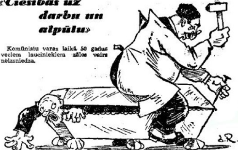
Darba zemnieka 50 gadu jubileja.

Komunistu varas laikā 50 gadus veciem lauciniekiem zāles vairs neizsniedza.