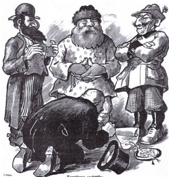
Eespējama varbūtība. (Varjagu sūtīšana.) Pēc neveiksmēm ar latviešu partijām, valsts prezidentam, loģiski, tagad atliek griezties ar valdības sastādīšanas uzdevumu pie minoritātēm. „Земля наша белая и обильная, но порядка в ней нетъ, — придите, князюте и волоките нами!”