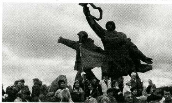
Skats no filmas "Pretrunīgā vēsture"