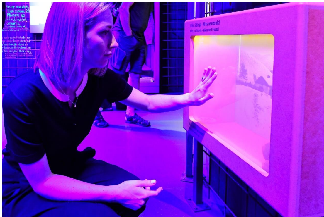
Kultūras ministre Agnese Lāce Latvijas Okupācijas muzeja ekspozīcijas apmeklējuma laikā.

Kultūras ministre Agnese Lāce, atbildot medijiem par paveikto amatā pirmajos mēnešos, norāda, ka jaunajā amatā centusies strādāt pie prioritārajiem jautājumiem. Ministre vēlas garantiju par Okupācijas muzeja ekspozīcijas atrašanos Stūra mājā bez termiņa ierobežojumiem.