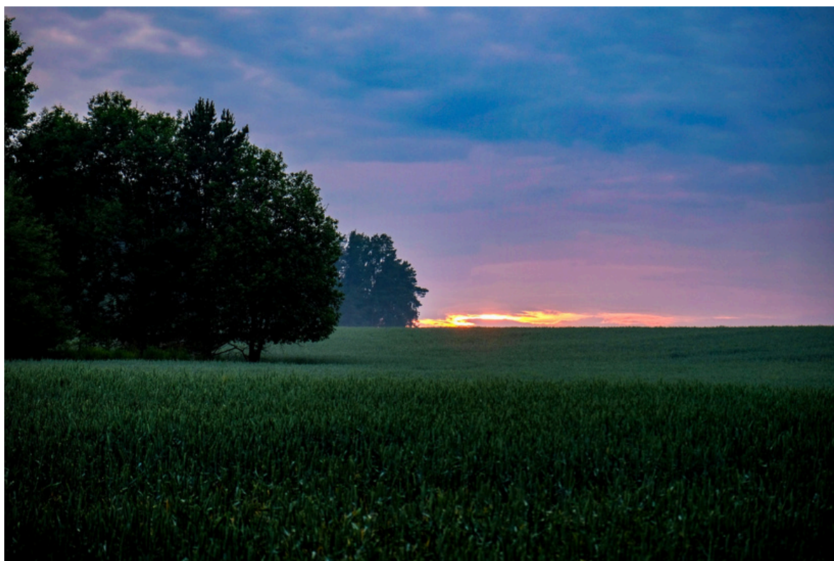
Latvijas Okupācijas muzeja saime

Sveicam vasaras saulgriežu laikā un vēlam saulainu, prieka pilnu un iedvesmojošu vasaru!