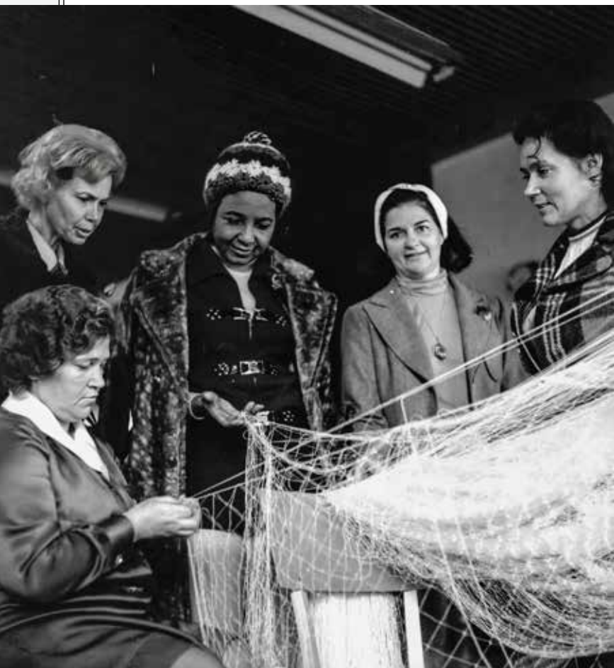
ASV NACIONĀLĀS SIEVIĒŠU LĪGAS ASOCIĀCIJAS PAR MIERU UN BRĪVĪBU DELEGĀCIJA APMEKLĒ ZVEJNIEKU KOLHOZU UZVĀRĀ. 1973. GADS

Rīga katru gadu uzņēma ap 50 000 ārzemju tūristu no 45 valstīm.