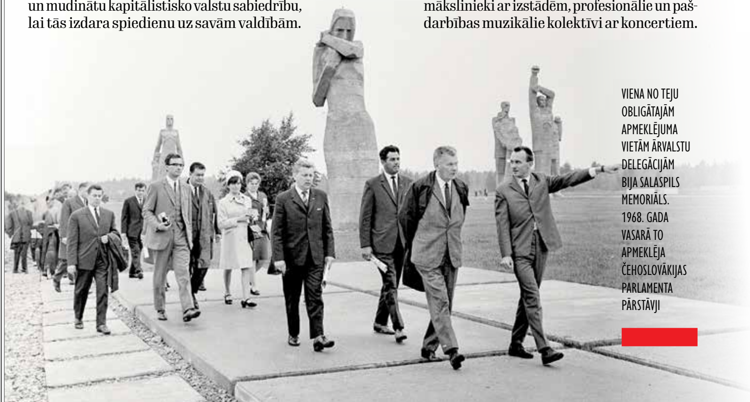
VIENA NO TEJU OBLIGĀTĀJĀM APMEKLĒJUMA VIETĀM ĀRVALSTU DELEGĀCIJĀM BIJA SALASPILS MEMORIĀLS. 1968. GADA VASARĀ TO APMEKLĒJA ČEHOSLOVĀKIJAS PARLAMENTA PĀRSTĀVJI

Visai aktīvi notika okupētās Latvijas kultūras darbinieku braucieni uz ārzemēm. Tie bija mākslinieki ar izstādēm, profesionālie un pašdarbības muzikālie kolektīvi ar koncertiem.