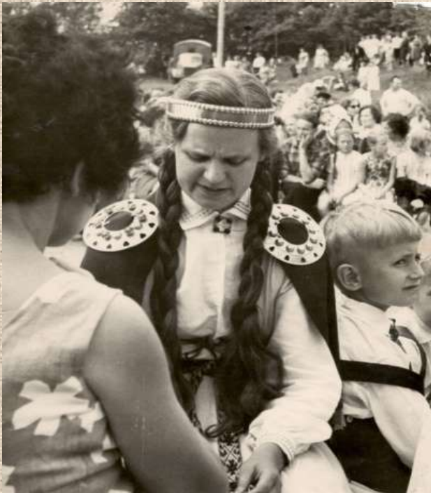
Deju koncertā Pļaviņās.

Mīļākās Omītes dejas bija "Pie Daugavas" un "Gatves deja".